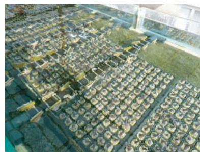
小さく見えるものが、移植するサンゴです。