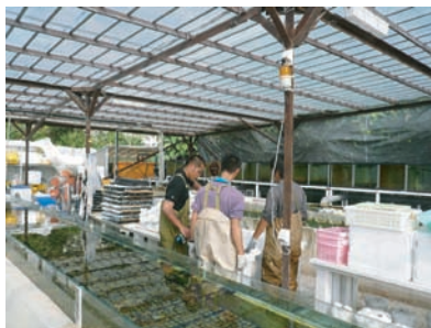
養殖している様子です。