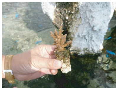
このようなサンゴを海に移植いたします。