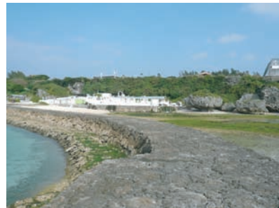
きれいな沖縄の海に移植いたします。

※時期としましては、半年ごと（4月・10月）に期間を分けて購入させていただきますので、移植のタイミング等合わせて、約半年から1年後に感謝状が贈られて参ります。